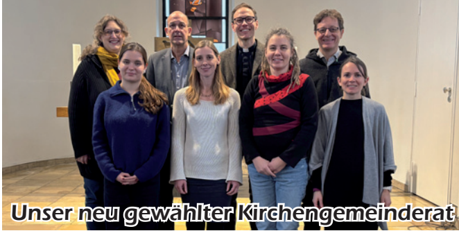
Unser neu gewählter Kirchengemeinderat