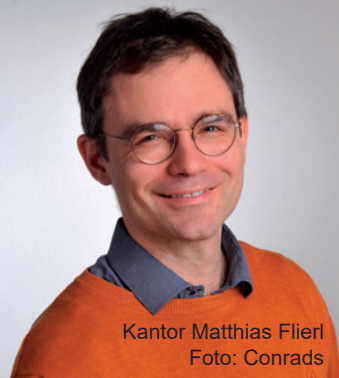
Kantor Matthias Flierl